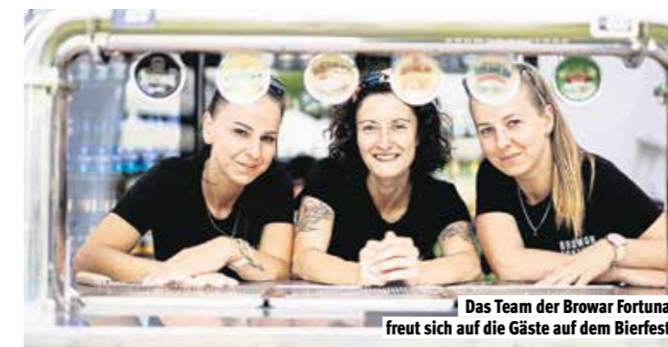
Das Team der Browar Fortuna freut sich auf die Gäste auf dem Bierfest

kumsliebhaber mit: das neue Mitosław Jasne Pełne, kürzlich auf Untappd zum besten polnischen Lager gekürt. Ein perfekter Einstieg, um die sympathischen Brauer und ihre Geschmacksvielfalt persönlich kennenzulernen.