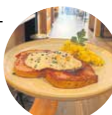
Fränkische Küche wie bei Mama

Beim diesjährigen Fränkischen Bierfest im Nürnberger Burggraben erwartet die Besucher eine ganz besondere Begegnung: Die traditionsreiche Brauerei Gutmann, seit Beginn fester Bestandteil des Bierfests, übergibt in diesem Jahr ihren Stand an das Bruderherz, Nürnbergs neues gastronomisches Highlight. Besucher dürfen sich weiterhin auf die beliebten Gutmann Hefeweizen-Spezialitäten freuen, die nun am Stand des Bruderherz ausgedient werden.