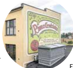
Mit den Brauern anstoßen

Seitdem widmet man sich hier – in Zusammenarbeit mit der Browar Fortuna, deren Braumeister auch hier zuständig ist – wieder voll und ganz dem historischen Grodziskie – ein Bier, das einst als „polnischer Champagner“ galt und international als „Grätzer“ bekannt ist.