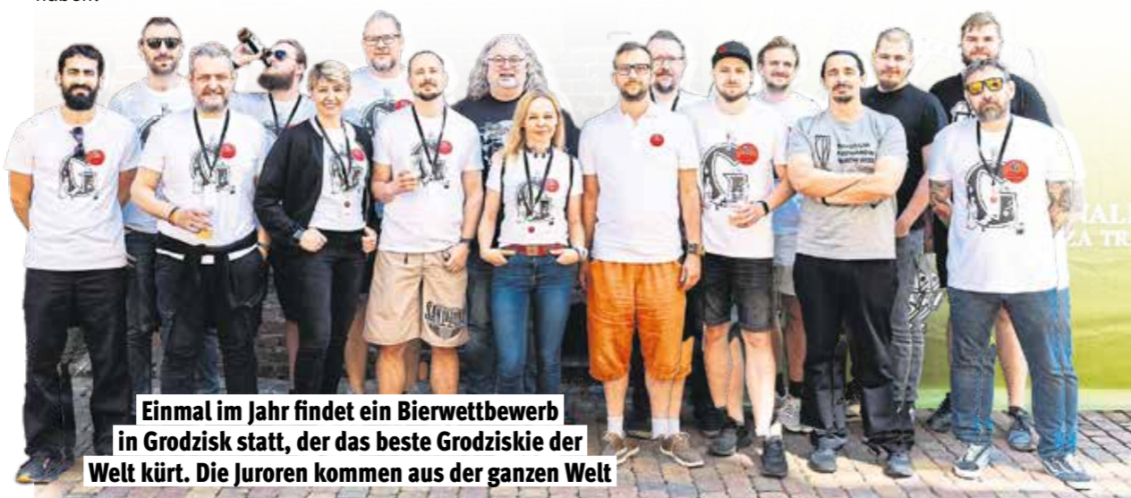
Einmal im Jahr findet ein Bierwettbewerb in Grodzisk statt, der das beste Grodziskie der Welt kürt. Die Juroren kommen aus der ganzen Welt

Brauerei Gutmann und Bruderherz gemeinsam beim Bierfest