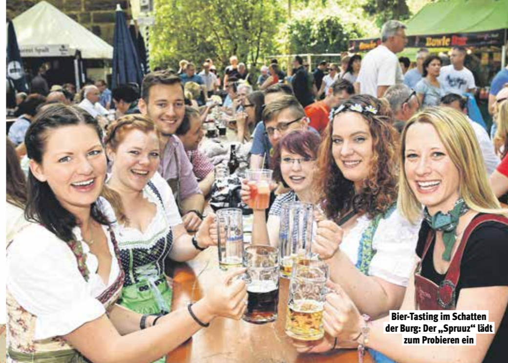
Bier-Tasting im Schatten der Burg: Der „Spruuz“ lädt zum Probieren ein