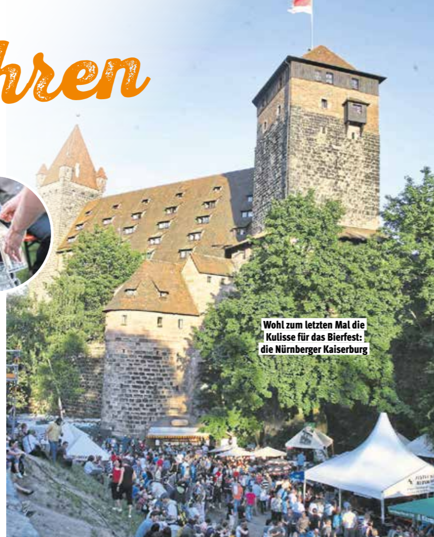
Wohl zum letzten Mal die Kullisse für das Bierfest: die Nürnberger Kaiserburg

Jene mittelalterlichen Schnepperschützen (die „Schnepper“ ist eine kleine Armbrust) prägten den Nimbus des Grabens bis heute: So steht auf der Hallerwiese als Erin-