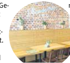
Rustikal und doch hell und gemütlich