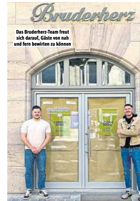
Das Bruderherz-Team freut sich darauf, Gäste von nah und fern bewirten zu können

such verspricht genussvolle Momente, herzliche Begegnungen und vor allem herausragende Bierkultur – ganz im Sinne der fränkischen Lebensfreude.