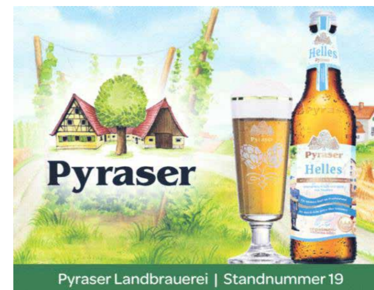
Pyraser Landbrauerei | Standnummer 19

Palais Schaumburg DIE KNEIPE DER BIERGARTEN