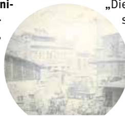
Die Brauerei in Grodzisk war vor 150 Jahren eine der größten in Deutschland, heute ist sie liebevoll restauriert wieder in Betrieb

schen auch mit zeitgemäßen Varianten wie dem Grodziska White IPA oder einem leichteren Session Ale. „Diese modernen Varianten sind eine Brücke zwischen Tradition und heutiger Bierkultur“, sagt Ostajewski mit einem Augenzwinkern. „So wollen wir zeigen, wie lebendig Tradition sein kann.“