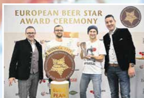
Die Brauerei Grodzisk hat letztes Jahr in Nürnberg einen goldenen European Beer Star gewonnen